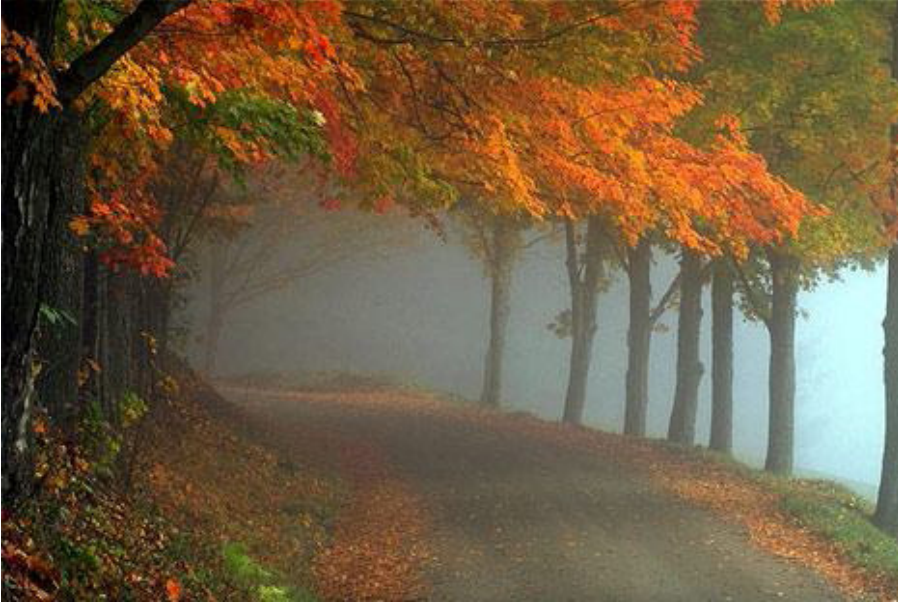
ILUSTRAÇÃO 1 - Floresta no outono Arial 10